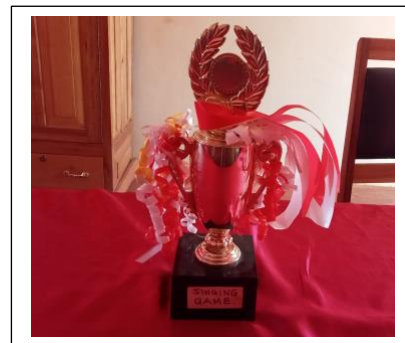
Årets segerpokal Dramatävling