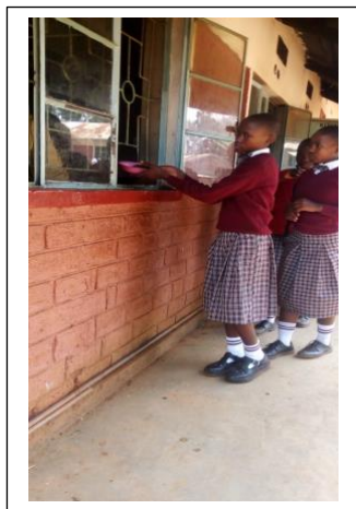
Lunch dags för åk 7