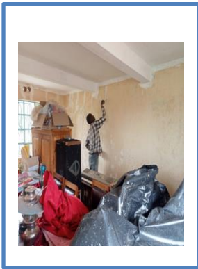
Målning av klassrum.

Nu när skolan är stängd har de välbehövliga underhållet och renovering av skolans byggnader påbörjats. Golv lagas, väggar ut och invändigt målas osv. Det afrikanska klimatet innebär stora påfrestningar bland annat under regnperioderna. Insekter bl. a. termiter ger sig på byggnadsdetaljer av trä.