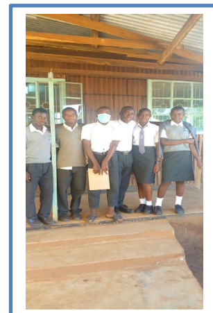
"Gamla" elever på besök