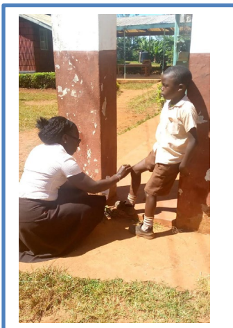
1: a hjälpen

Ovan en lärare som lämnar över ett par nya skor till en av de yngre